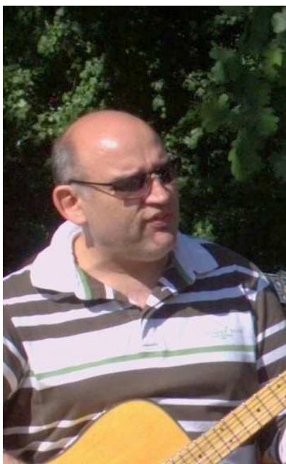
Berlin 2012