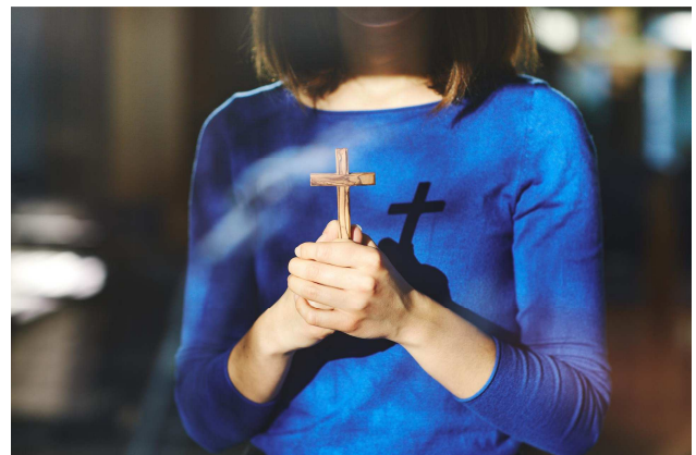
Motivbild zur Monatsandacht/ TH Elstal

Der Prophet mahnt uns, unser ganzes Leben, all unser Denken und Handeln, von unserem Glauben an Gott bestimmen zu lassen. Und in diesem Sinne umzukehren: die anderen Götter in unserem Leben zu entlarven und uns willentlich von ihnen abzuwenden, um uns allein dem Gott Israels, dem Vater Jesu Christi, zuzuwenden. Das ist nämlich das Besondere an Gott, "dem HERRn", dass er uns in Jesus Christus sein Herz gezeigt hat: voller Liebe, Barmherzigkeit und Gerechtigkeit. Wenn wir uns IHM ganz unterstellen, dann werden wir von diesen Werten so erfüllt, dass sie unser alltägliches Handeln bestimmen, sowohl in der Gemeinschaft der Christen als auch in Schule, Studium oder Beruf. Dann kann man sich nicht in einem Bereich christlich verhalten und in einem anderen nicht, sondern Gottes Herzschlag wird zu unserem: Liebe und Gerechtigkeit werden für uns immer und überall bestimmend.