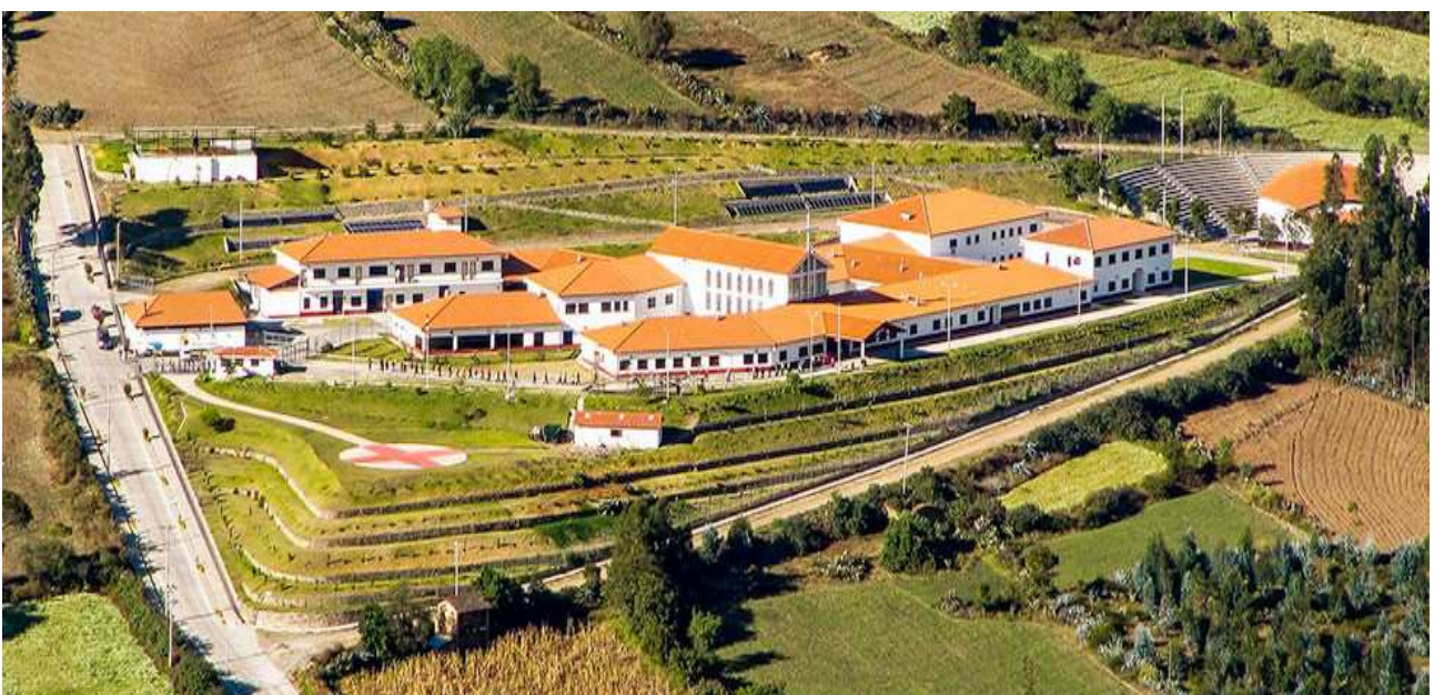
Es begann mit einem Gebet : 10 Jahre Hospital Diospi Suyana ("Wir vertrauen auf Gott") in Peru